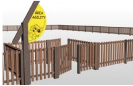
SIMPLE PORTIQUE D'ENTRÉE DANS LA ZONE D'AGILITY