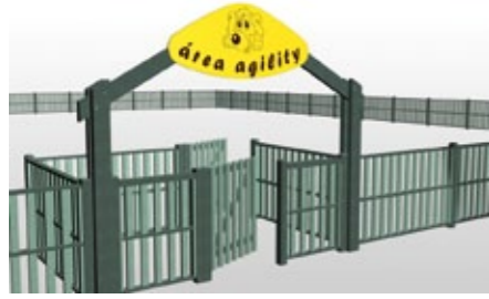
DOUBLE PORTIQUE D'ENTRÉE DANS LA ZONE D'AGILITY